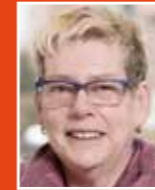
Heide Behlen Team Tagespflege